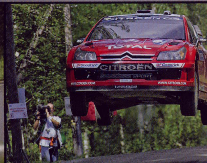
Deutschland-Rallye Sebastian Loeb will Rev...