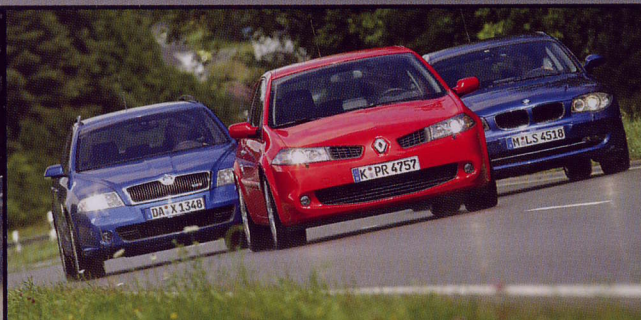
Sportliche Diesel im Vergleich BMW 120d, Renault Mégane RS und Skoda Octavia RS