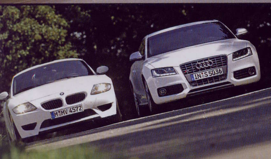
Coupé-Interpretationen in Weiß BMW Z4 M Coupé und Audi S5