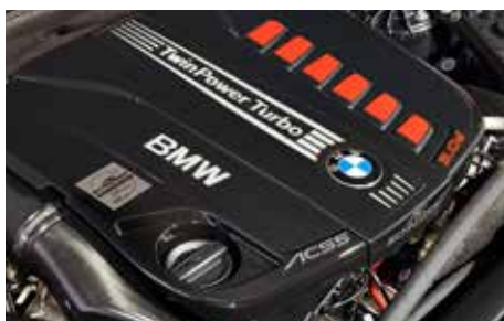
Leistungssteigerungen für 520d, 530d, 530i, 540i, M550i – inkl. Garantie