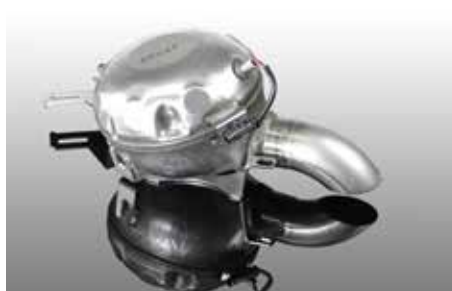
Soundmodul mit Fernbedienung