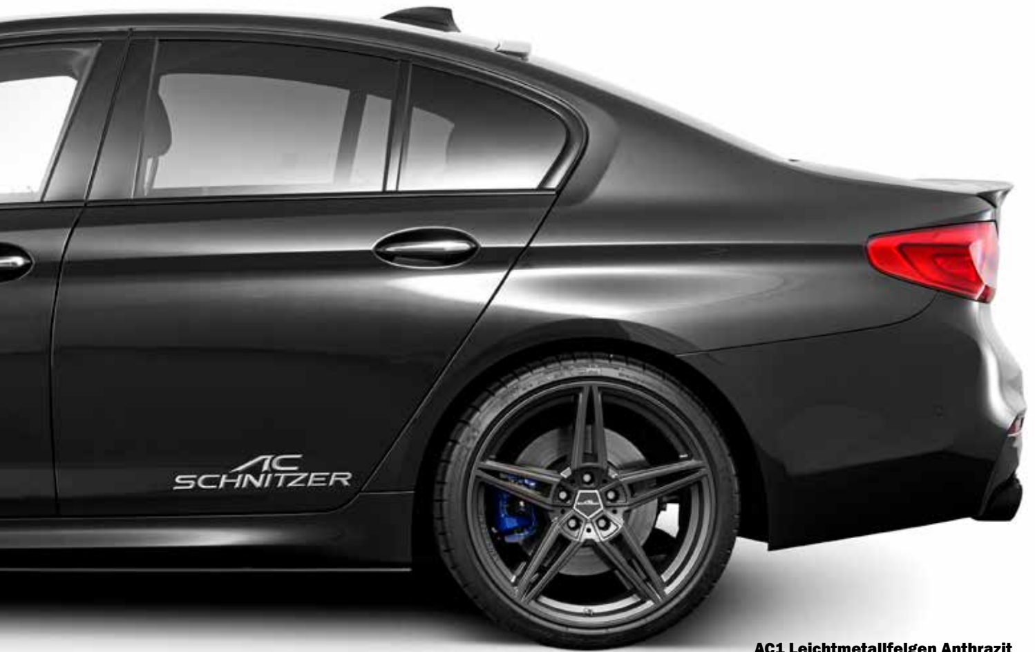
AC1 Leichtmetallfelgen Anthrazit