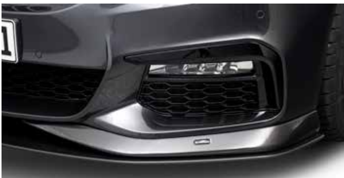
Carbon Frontspoilerelemente, Frontsplitter