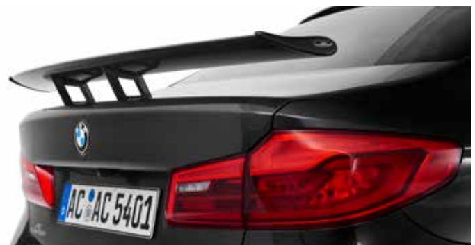
Carbon „Racing“ Heckflügel