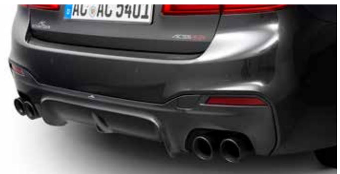
Heckdiffuser mit Schalldämpfer und je 2 „Sport schwarz“ Endblenden in rechts/links Kombination