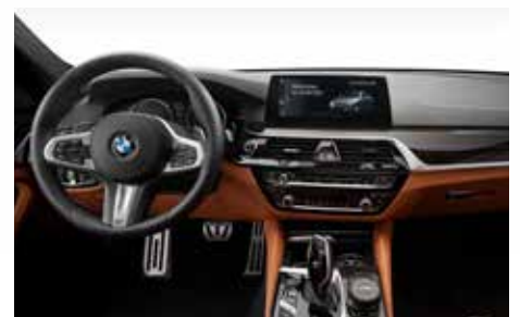
Aluminium Pedalerie, Fußstütze, Aluminium Cover „Black Line“ für iDrive Controller, Velours Fußmatten, Keyholder