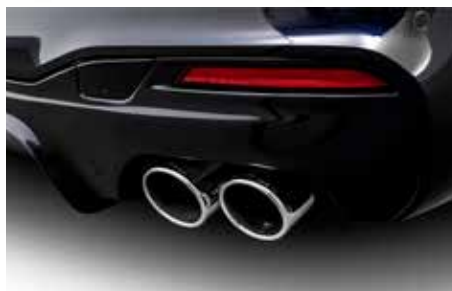
„Quad Sport“ Endblenden verchromt (schwarz ohne Abb.) in rechts/links Kombination