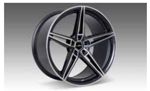
AC1 Leichtmetallfelgen BiColor Schwarz oder Anthrazit in 19 und 20 Zoll