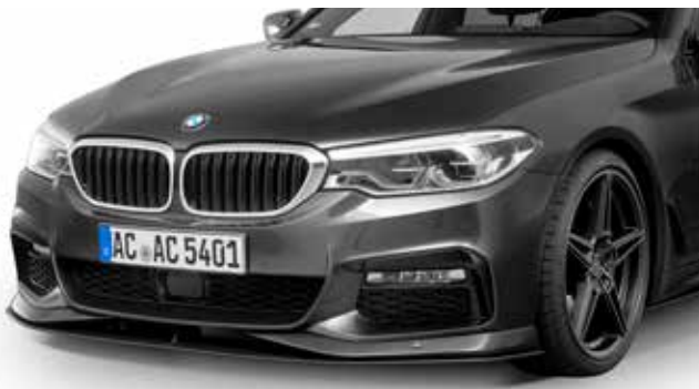
Carbon Frontspoilerelemente, Frontsplitter, AC1 Leichtmetallfelgen Anthrazit