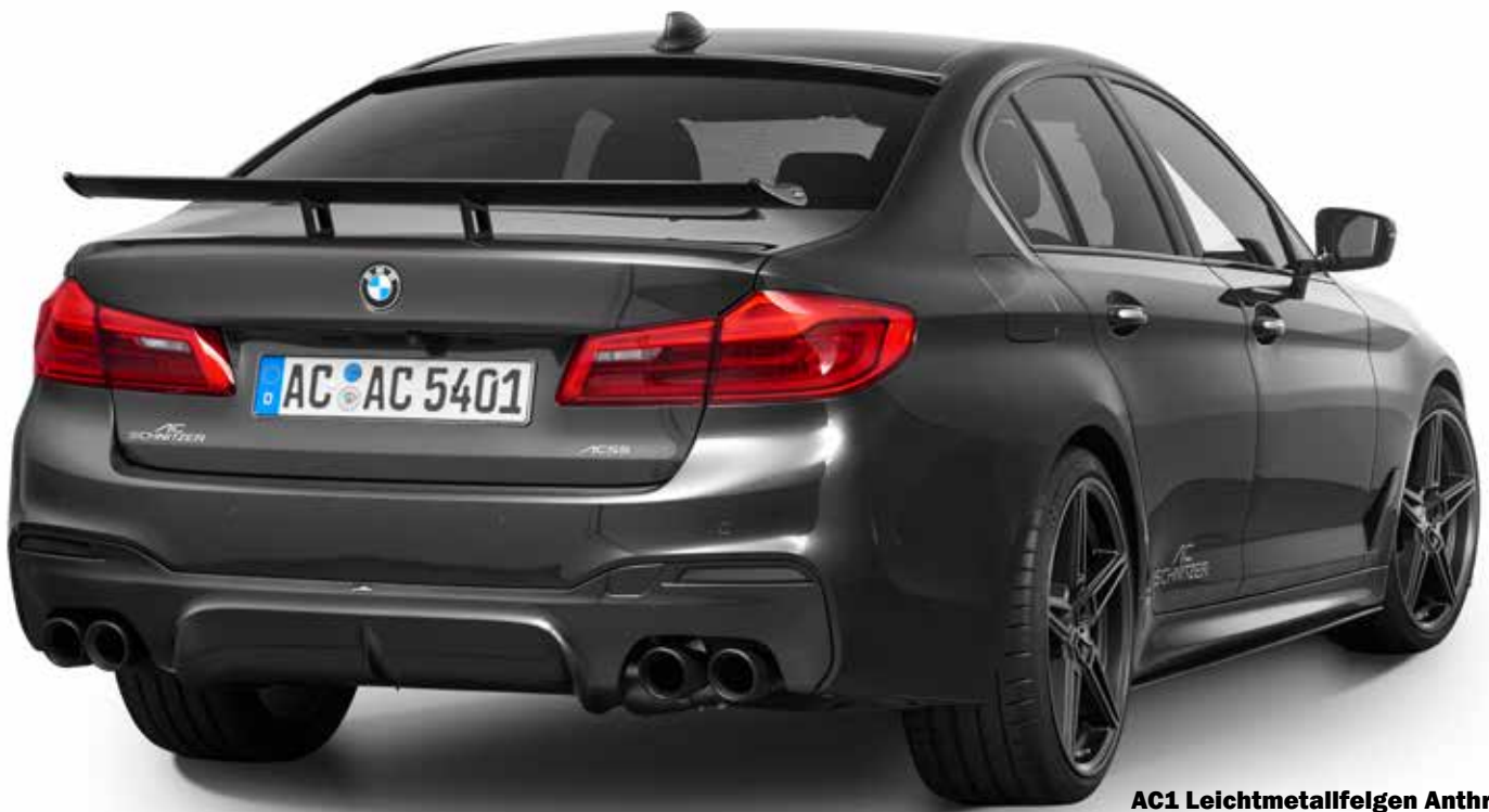
AC1 Leichtmetallfelgen Anthrazit