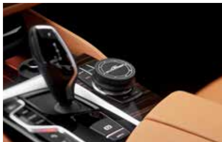
Aluminium Cover „Black Line“ für iDrive Controller