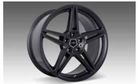
AC1 Leichtmetallfelgen BiColor Schwarz oder Anthrazit in 19 und 20 Zoll