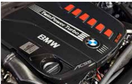
Leistungssteigerungen für 520d, 530d, 530i, 540i, M550i – inkl. Garantie