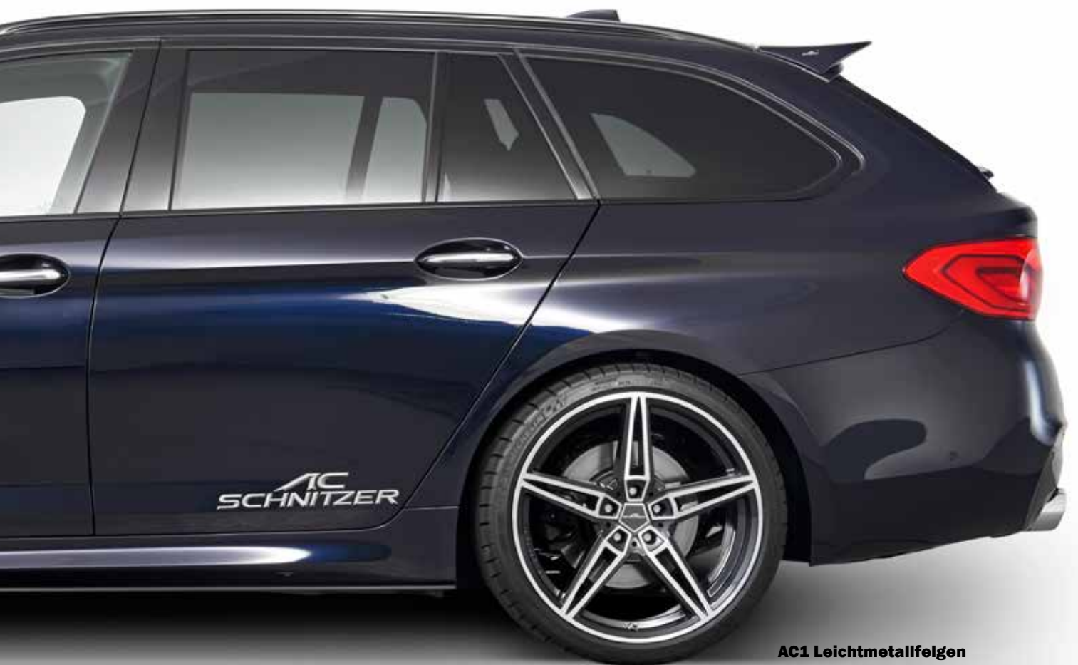
AC1 Leichtmetallfelgen BiColor schwarz