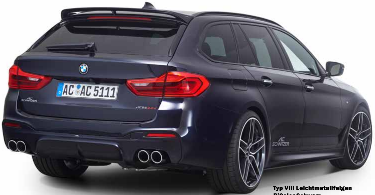
Typ VIII Leichtmetallfelgen BiColor Schwarz