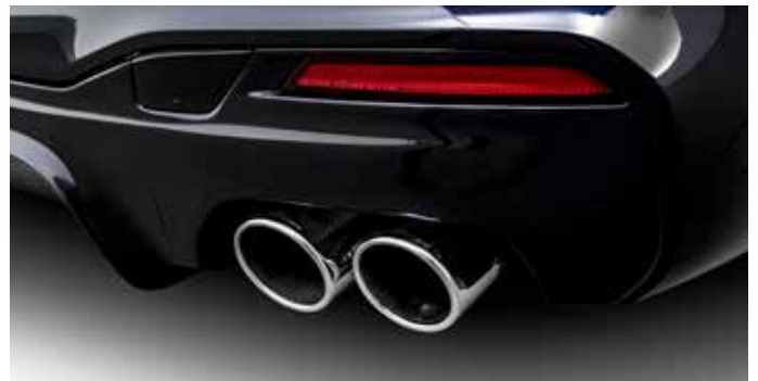
„Quad Sport“ Endblenden verchromt (schwarz ohne Abb.) in rechts/links Kombination