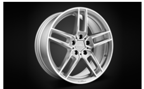
Typ VIII Leichtmetallfelgen BiColor Silber, Anthrazit (o. Abb.) oder BiColor Schwarz in 19 und 20 Zoll