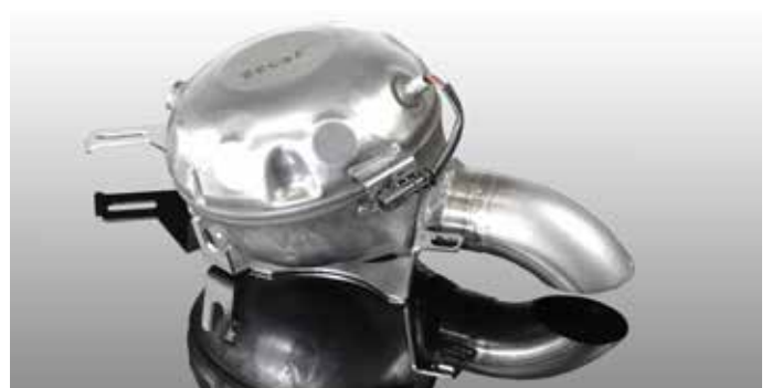
Soundmodul mit Fernbedienung