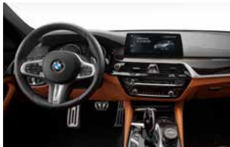
Aluminium Pedalerie, Fußstütze, Aluminium Cover „Black Line“ für iDrive Controller, Velours Fußmatten, Keyholder