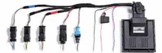
Leistungssteigerungen inkl. Baugruppengarantie für 840d mit 235 kW/320 PS auf 279 kW/380 PS und M 850i mit 390 kW/530 PS auf 456 kW/620 PS