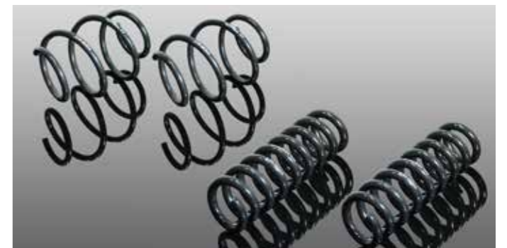
Fahrwerksfedernsatz, Tieferlegung vorne: ca. 20 mm, hinten: ca. 20 mm