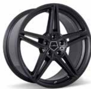
AC1 Leichtmetallfelge 20 Zoll Anthrazit