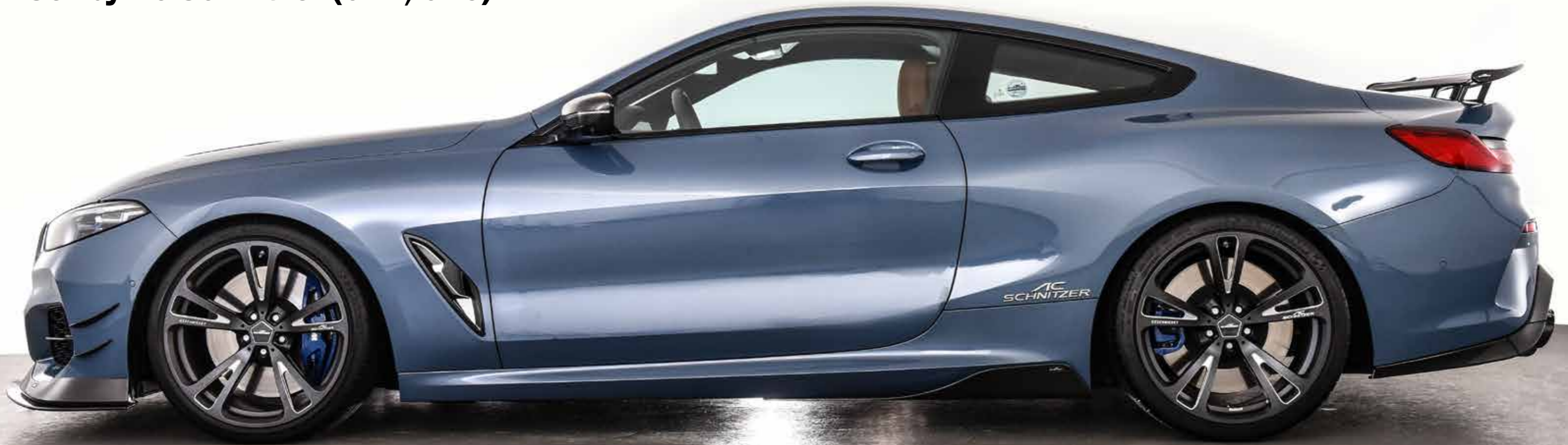
AC3 Leichtbau-Schmiedefelgen BiColor Anthrazit/Silber