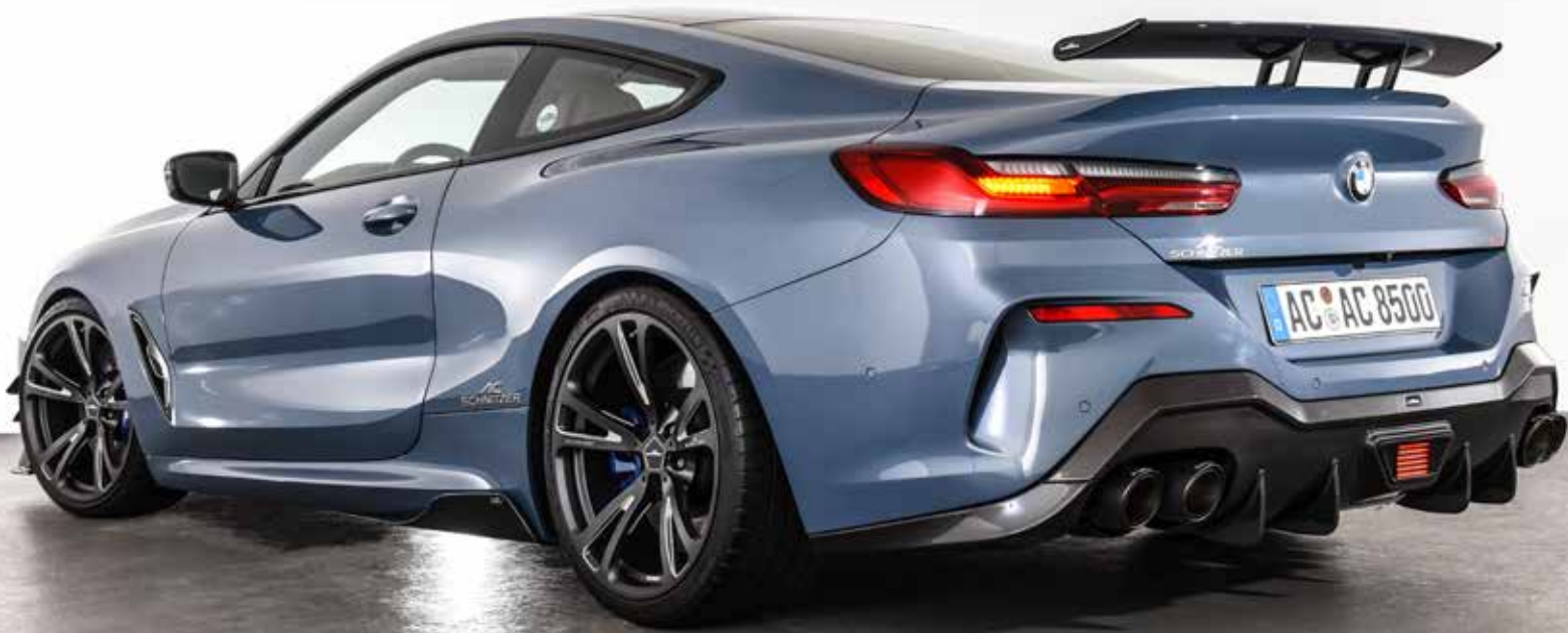
AC3 Leichtbau-Schmiedefelgen BiColor Anthrazit/Silber