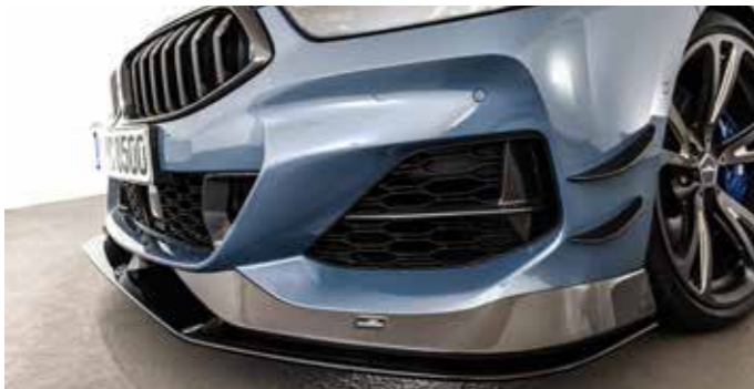
Carbon Frontspoiler-Elemente, Frontsplitter, Carbon Front Side Wings, AC3 Leichtbau-Schmiedefelge BiColor Anthrazit/Silber