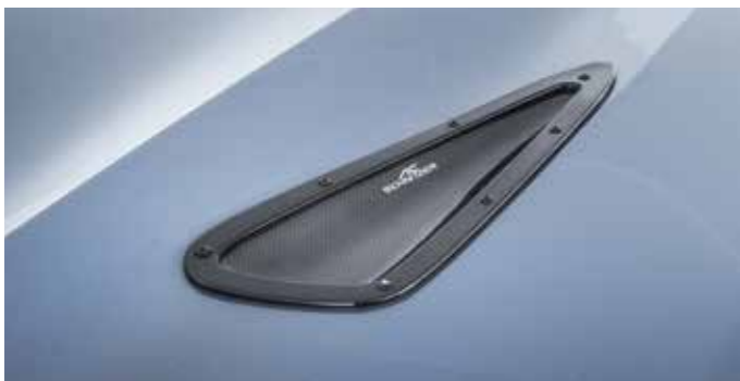
Bonnet Vents mit Carbon Einlegern