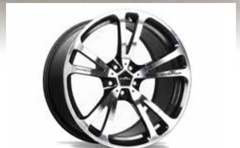
AC3 Leichtbau-Schmiedefelge 20 Zoll BiColor Silber/Anthrazit