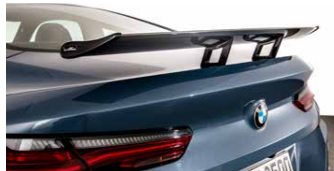
Carbon „Racing“ Heckflügel