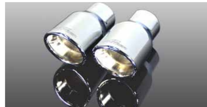
„Sport“ Auspuffendblenden, verchromt, „Sport schwarz“ ohne Abbildung