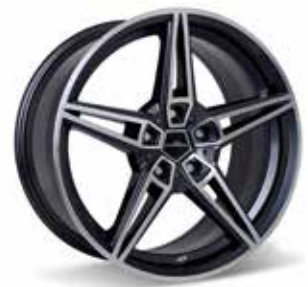
AC1 Leichtmetallfelge 20 Zoll BiColor