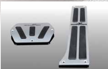
Aluminium Pedalerie, 2-teilig