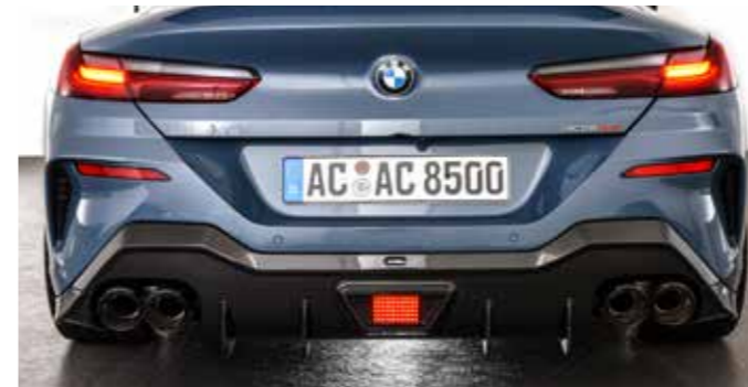
Carbon Heckdiffusor mit optionaler Bremsleuchte, Schalldämpfer mit „Carbon Sport“ Auspuffendblenden