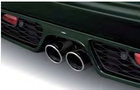
Schalldämpfer mit „Sport“ Endblenden