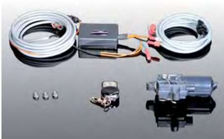
Track Mode Klappensteuerung mit Fernsteuerung zur Soundoptimierung