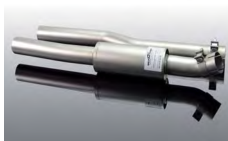
Soundrohr für Schalldämpfer