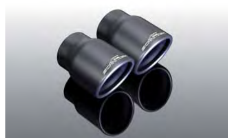
Endblenden „Sport“ schwarz oder verchromt