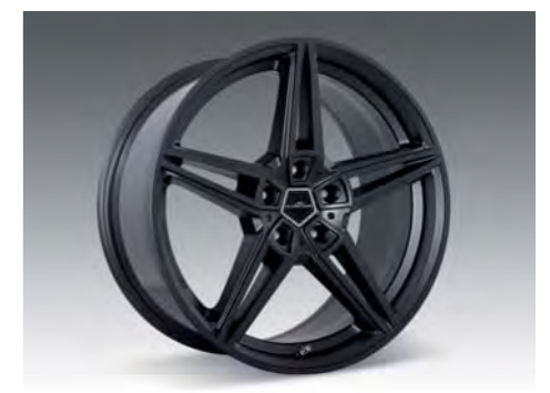
AC1 Leichtmetallfelgen Anthrazit 7,5 x 19"