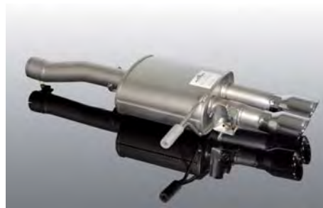
Schalldämpfer mit schwarzen „Sport“ Endblenden