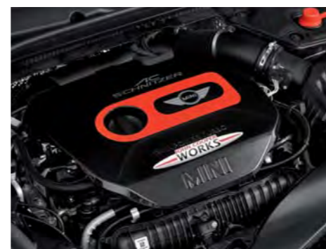
Leistungssteigerungen für MINI Cooper, Cooper S und John Cooper Works Motoroptik