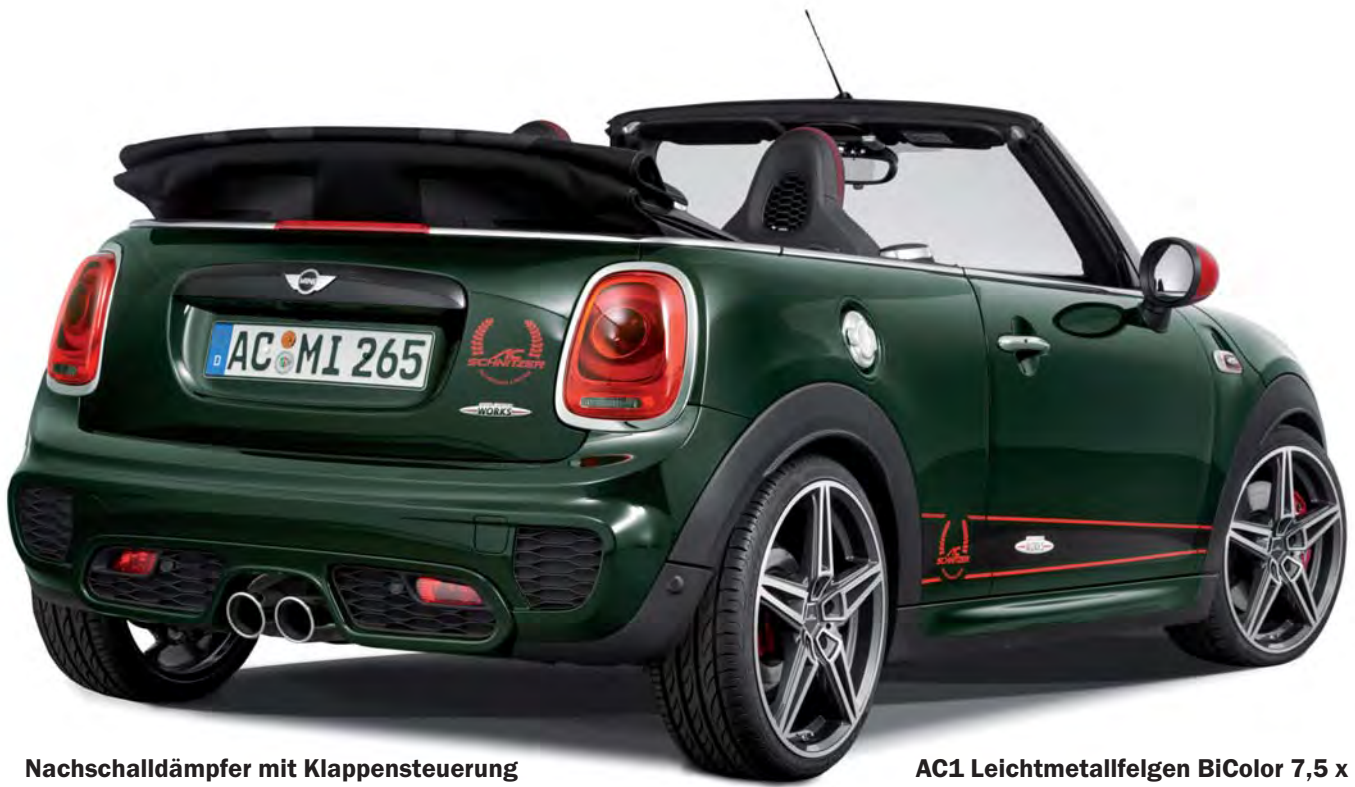
Nachschalldämpfer mit Klappensteuerung und „Sport“ Endblenden