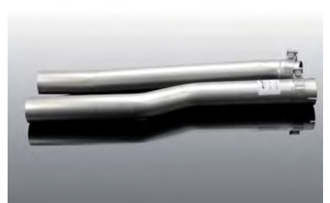
Soundrohr für Schalldämpfer Exportversion