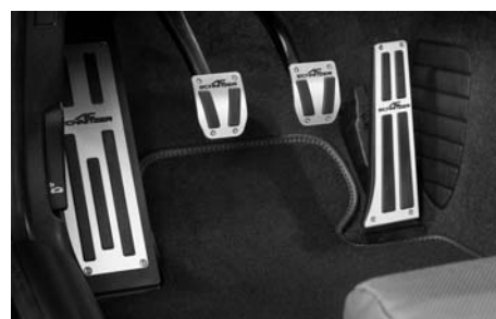
Aluminium Pedalerie, Fußstütze, Velours Fußmatten