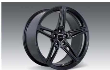
AC1 Leichtbau-Schmiedefelge Anthrazit