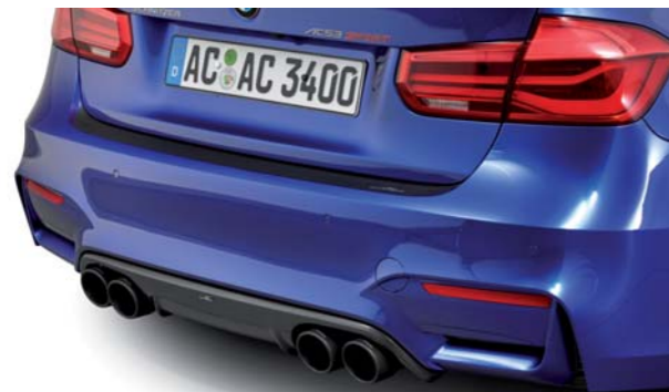
Heckschürzenschutzfolie, Carbon Heckdiffusor, Endblenden „Sport schwarz“