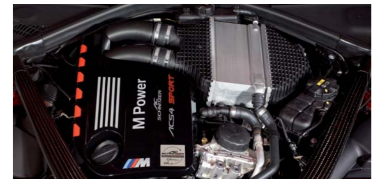
Leistungssteigerung für M3/M4 auf 375 kW/510 PS, Motoroptik auch für Fahrzeuge mit Competition Paket