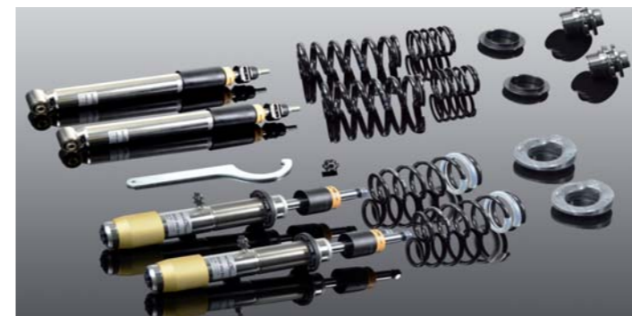
RS Gewindefahrwerk, höhenverstellbar und einstellbar in Druck- und Zugstufe