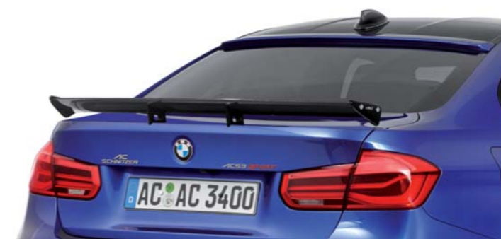
Carbon Heckflügel (Export)