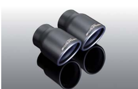
Endblenden „Sport schwarz“