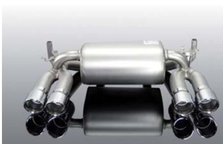
Klappen-auspuffanlage mit je zwei Endblenden im „Sport“ oder „Sport schwarz“ Design in links rechts Kombination, optional: Soundrohr (o. Abb.)