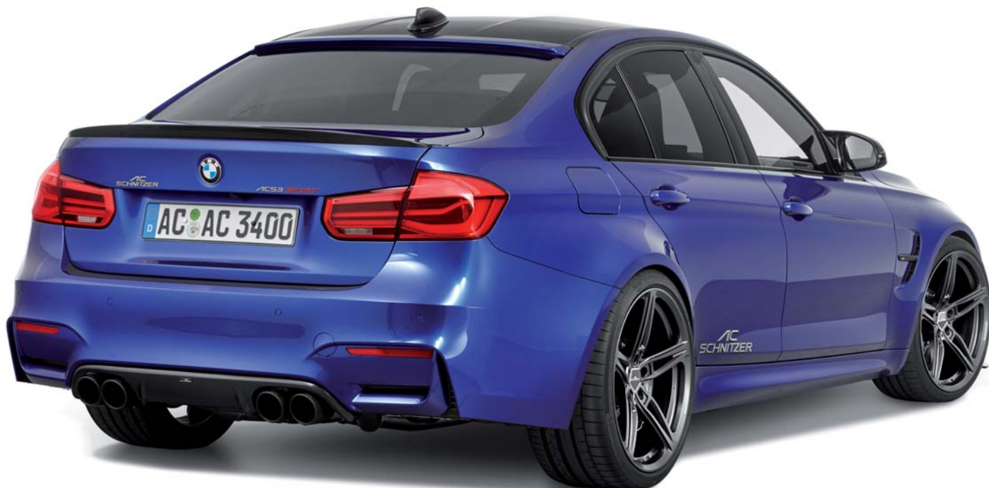
AC1 Leichtbau-Schmiedefelgen Anthrazit