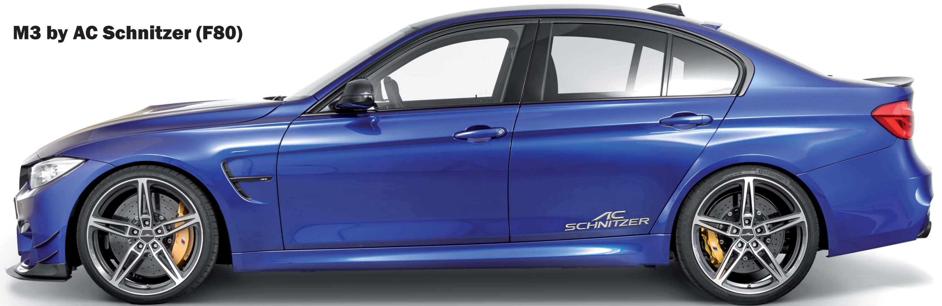
AC1 Leichtbau-Schmiedefelgen BiColor