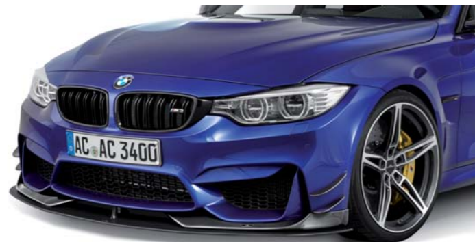
Carbon Frontspoiler-Elemente, Frontsplitter, Front Side Wings