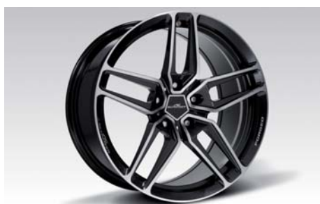
Typ VIII Leichtbau-Schmiedefelge BiColor schwarz