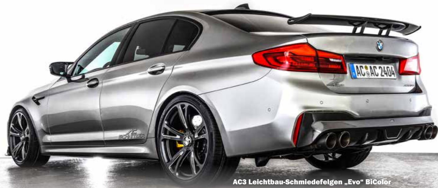
AC3 Leichtbau-Schmiedefelgen „Evo“ BiColor anthrazit/silber mit grauem Zentralverschluss Carbon „Racing“ Heckflügel