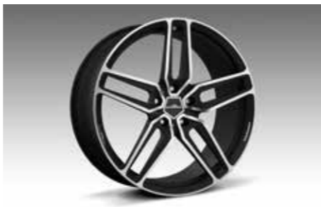
Typ VIII Leichtbau-Schmiedefelge BiColor 21 Zoll