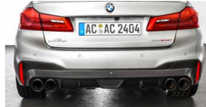
Heckschürzenschutzfolie, Carbon Heckdiffusor, Schalldämpfer mit „Carbon Sport“ Auspuffendblenden