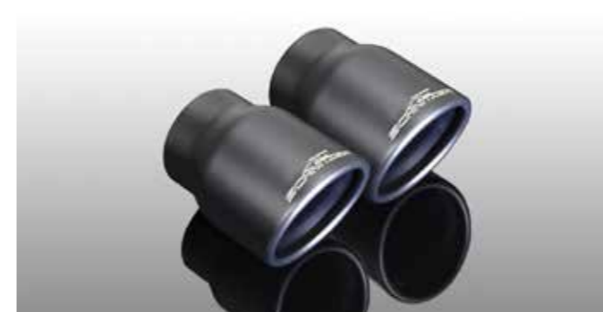
„Sport schwarz“ Auspuffendblenden „Sport“ Auspuffendblenden, verchromt (ohne Abbildung)