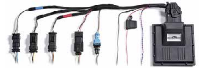
Leistungssteigerung inkl. Baugruppengarantie für M5 (ohne OPF) auf 515 kW/700 PS/850 Nm M5 Competition - in Vorbereitung