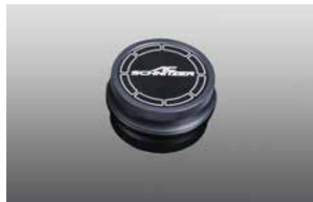
Aluminium Cover „Black Line“ für den iDrive System Controller