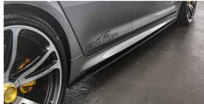
Seitenschweller, AC3 Leichtbau-Schmiedefelgen „Evo“ BiColor silber/anthrazit mit goldenem Zentralverschluss