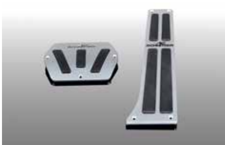
Aluminium Pedalerie, 2-teilig