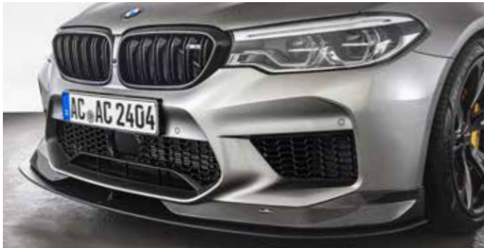
Carbon Frontspoiler-Elemente, Frontsplitter, AC3 Leichtbau-Schmiedefelge BiColor anthrazit/silber