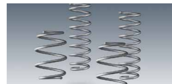
Fahrwerksfedernsatz, Tieferlegung vorne: ca. 20 - 25 mm, hinten: ca. 10 - 15 mm