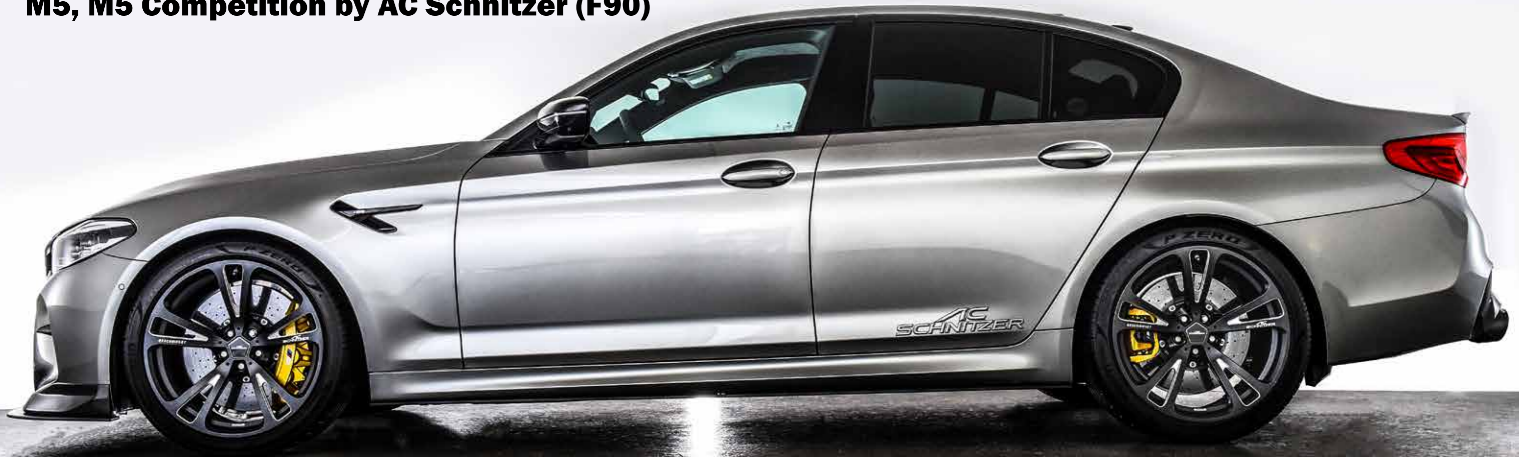
AC3 Leichtbau-Schmiedefelgen BiColor anthrazit/silber