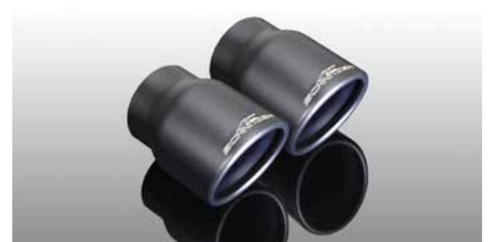
Auspuffblenden „Sport“ schwarz (nur in Verbindung mit Sportnachschalldämpfer)