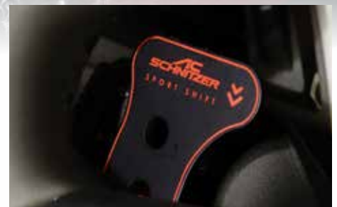
Aluminium Schaltwippen Set