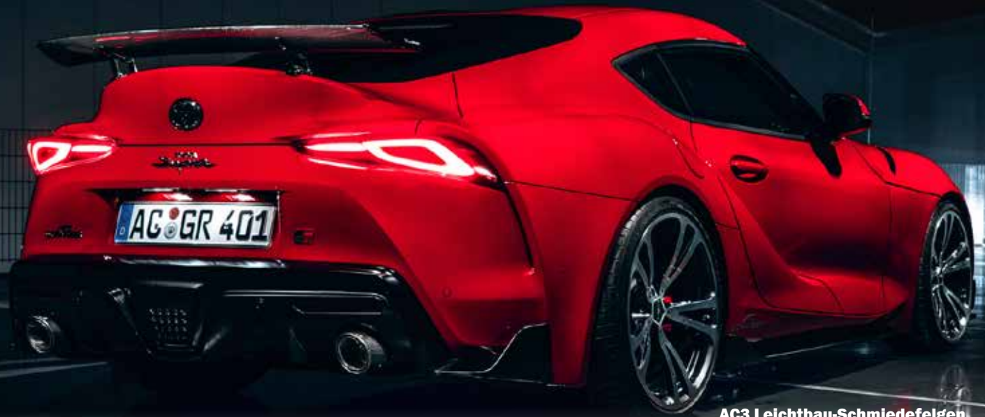
AC3 Leichtbau-Schmiedefelgen BiColor Silber / Anthrazit 20 Zoll