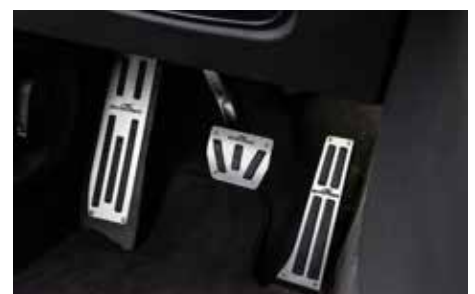
Aluminium Pedalerie und Fußstütze