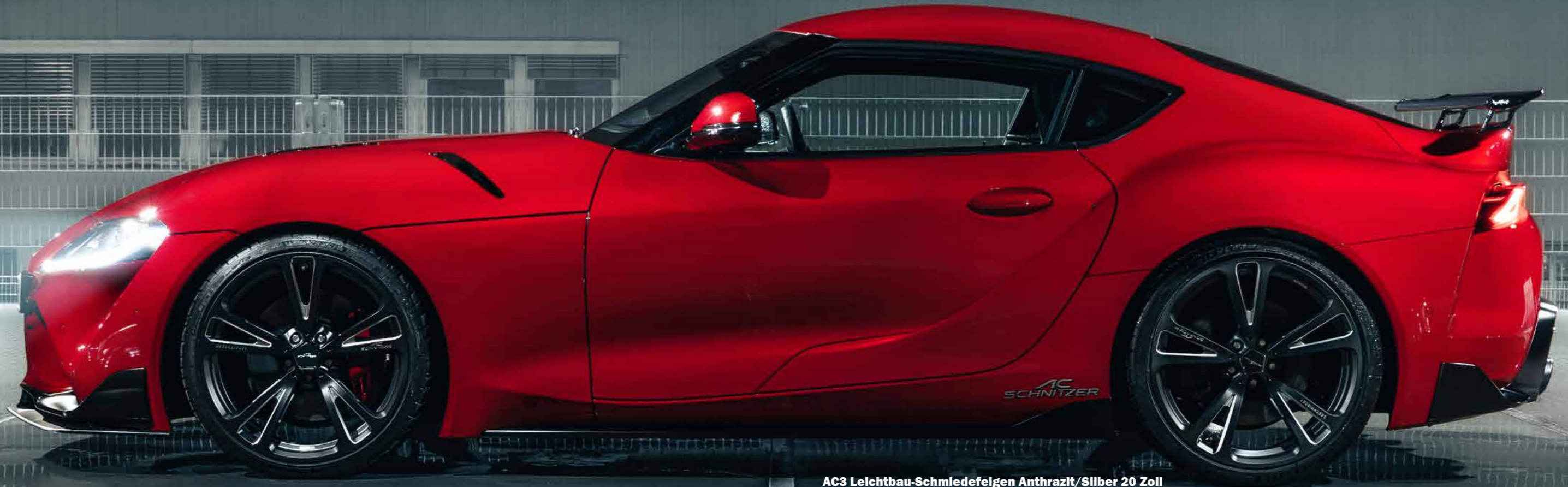
AC3 Leichtbau-Schmiedefelgen Anthrazit/Silber 20 Zoll