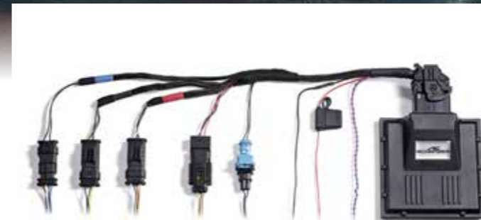
Leistungssteigerung inkl. Baugruppengarantie für 3.0l mit 250 kW/340 PS/500 Nm auf 294 kW/400 PS/600 Nm