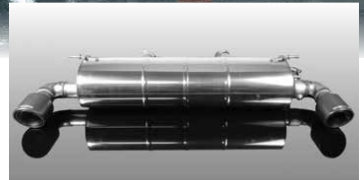
Sportnachschalldämpfer mit 2 Auspuffblenden „Sport“ Carbon oder schwarz