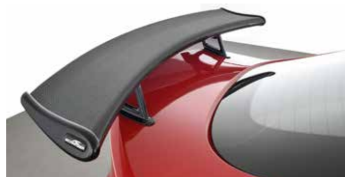
Carbon „Racing“ Heckflügel Optional Gurney Flap (ohne Abb.)