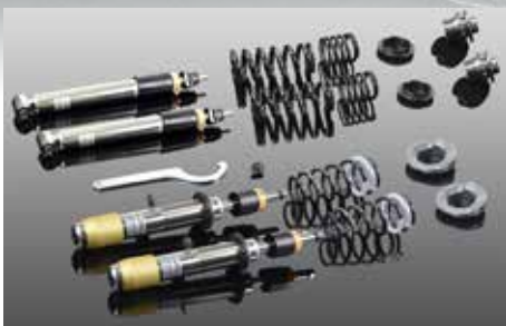
RS Gewindefahrwerk, höhenverstellbar und einstellbar in Zug- und Druckstufe inkl. Tieferlegung ca. 25 mm