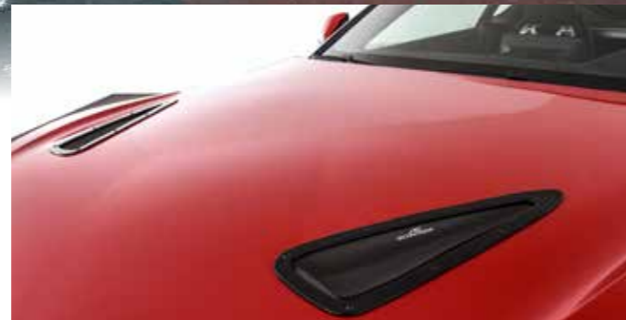
Bonnet Vents (in Deutschland gilt: Einsatz nur für Rennsportzwecke)