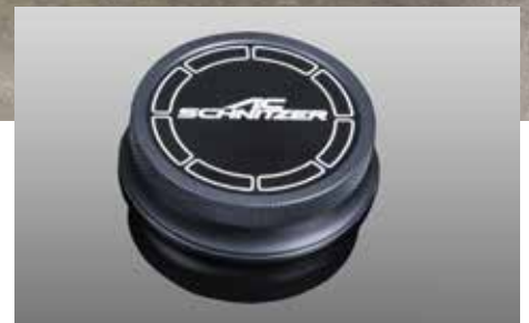
Aluminium Cover „Black Line“ für den iDrive System Controller