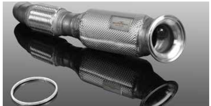
Downpipe mit Sportkatalysator und 300 cps für M40i xDrive