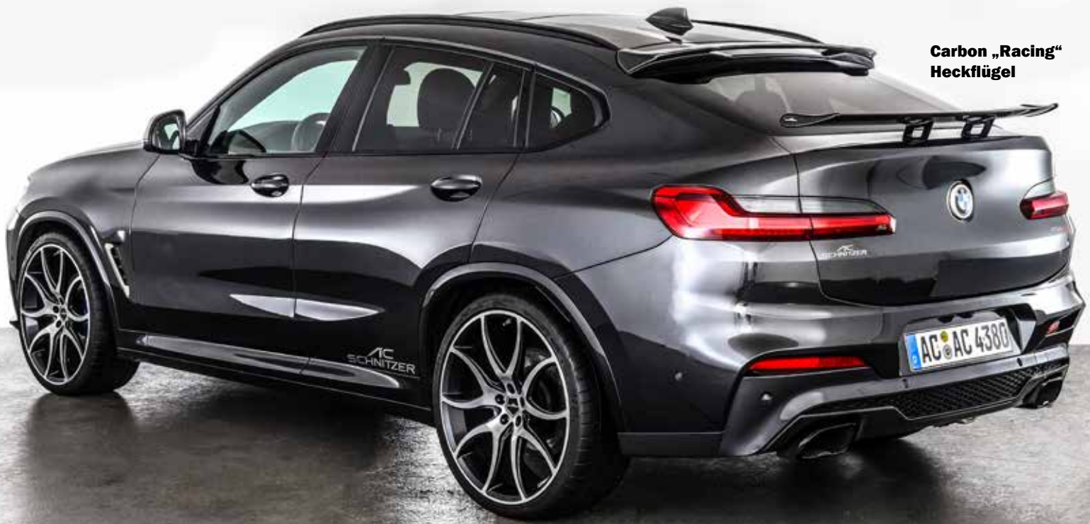
AC2 Leichtmetallfelgen BiColor 22"