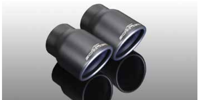
„Sport“ Auspuffendblenden, schwarz