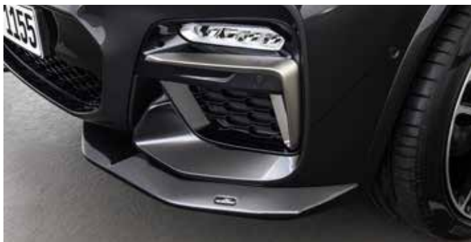
Frontspoiler-elemente für Fzg. mit M-Technik