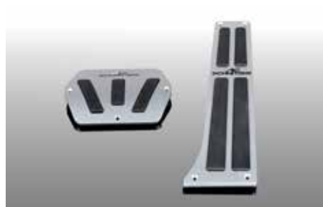
Aluminium Pedalerie, 2-teilig