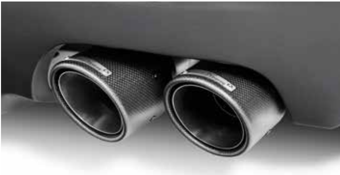
Carbon „Sport“ Auspuffendblenden