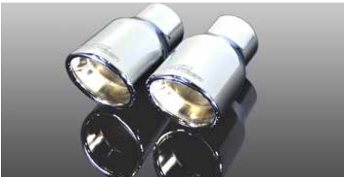
„Sport“ Auspuffendblenden, verchromt