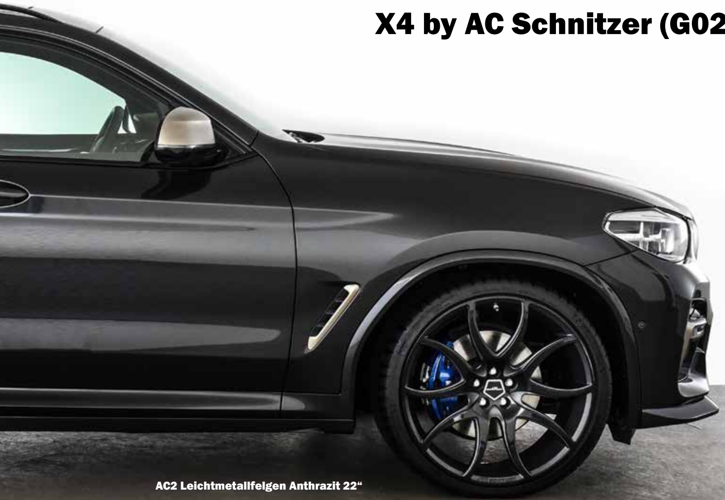
AC2 Leichtmetallfelgen Anthrazit 22"