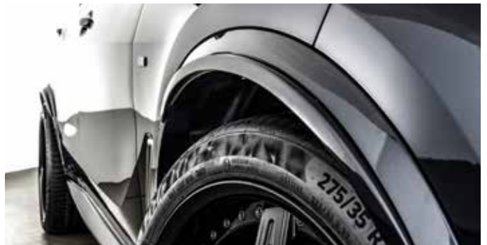
Radlaufverbreiterungen jeweils: 14 mm vorne und 26 mm hinten