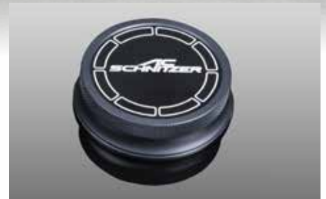
Aluminium Cover „Black Line“ für den iDrive System Controller