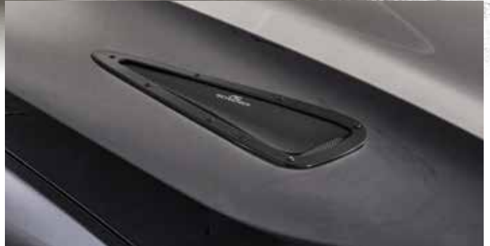
Bonnet Vents (in Deutschland gilt: Einsatz nur für Rennsportzwecke)