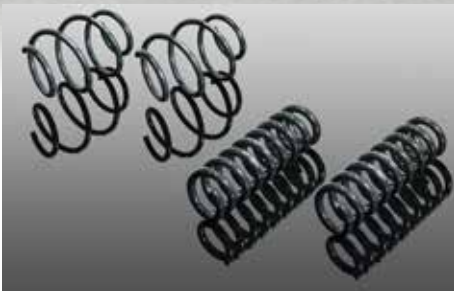
Fahrwerksfedernsatz, Tieferlegung vorne: ca. 20 - 25 mm hinten: ca. 20 - 25 mm