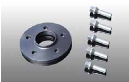
Spurverbreiterung 12 mm pro Seite zur Weiterverwendung der Serienfelgen