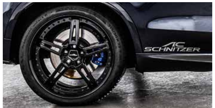
Schriftzug 250 mm, AC1 Rennsport-Schmiedefelge Schwarz in 22 Zoll