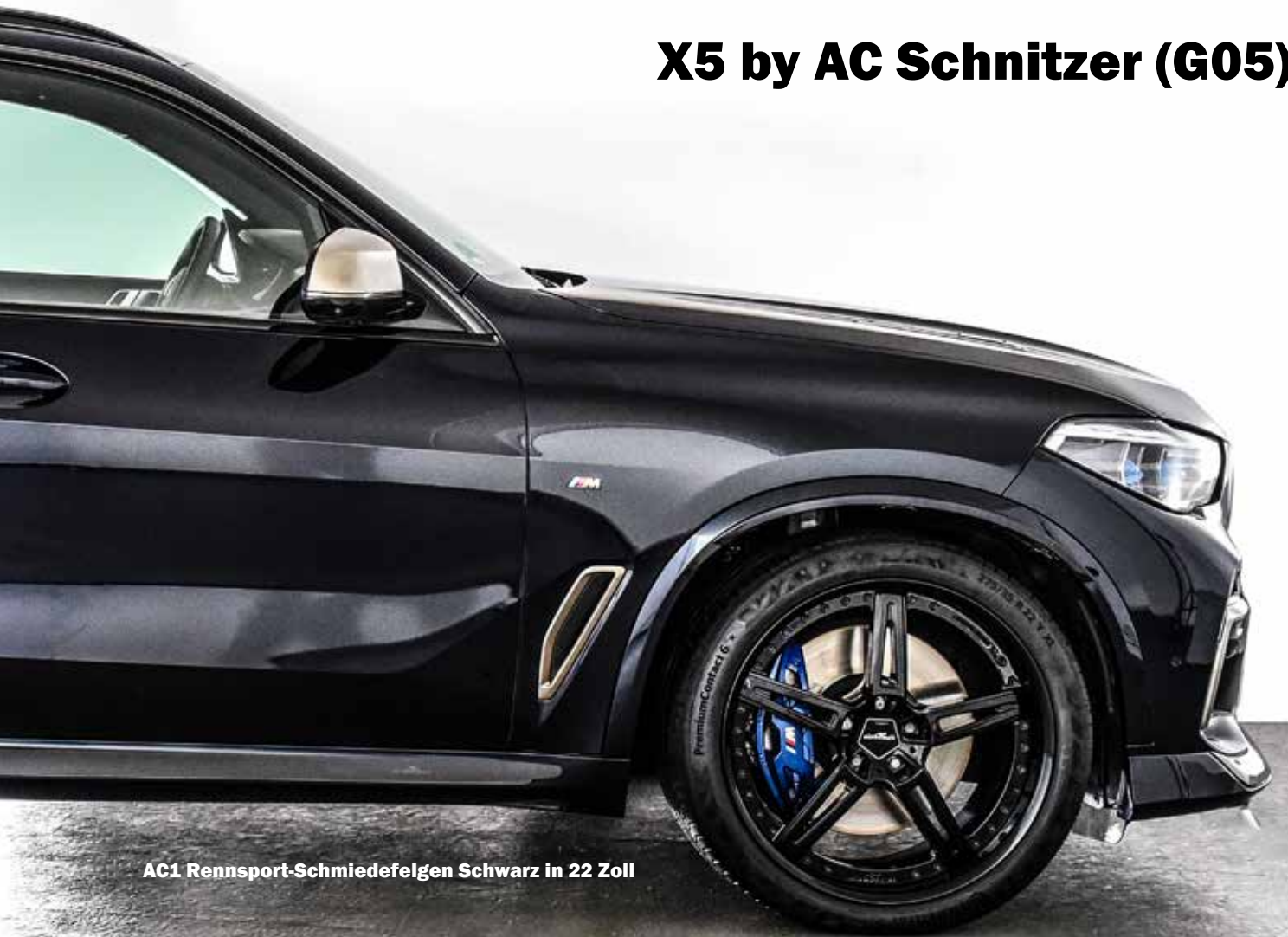
AC1 Rennsport-Schmiedefelgen Schwarz in 22 Zoll