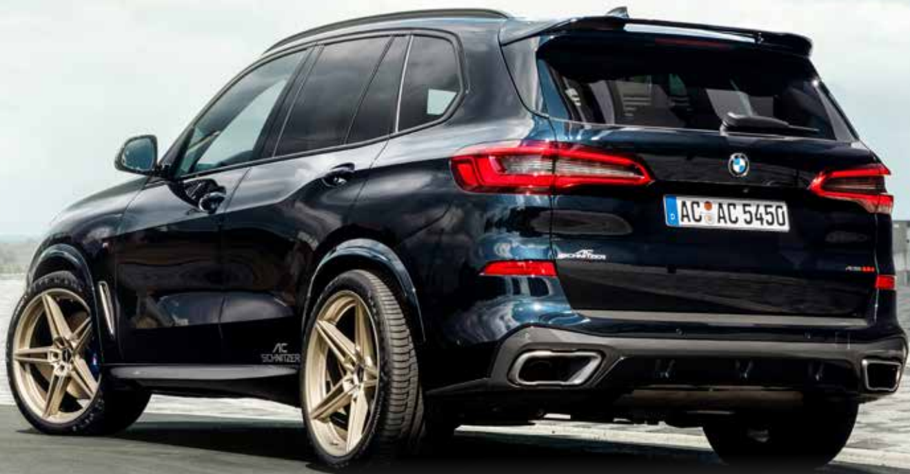
AC1 Leichtmetallfelgen mit individueller Lackierung in 22 Zoll