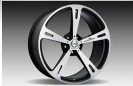
Typ V Leichtbau-Schmiedefelge BiColor in 22" Typ VIII Rennsport-Schmiedefelge BiColor (o. Abb.) in 22"