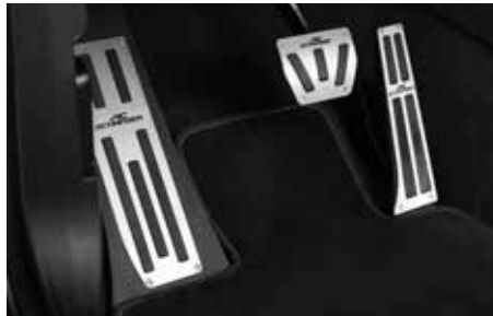
Aluminium Pedalerie (2-teilig) und Fußstütze