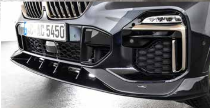
Frontspoiler für X5 mit M-Aerodynamikpaket