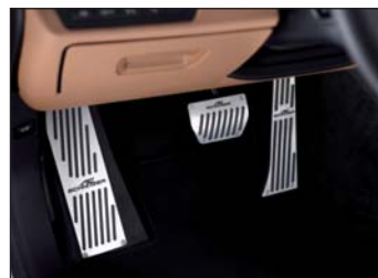
Aluminium Pedalerie, Fußstütze