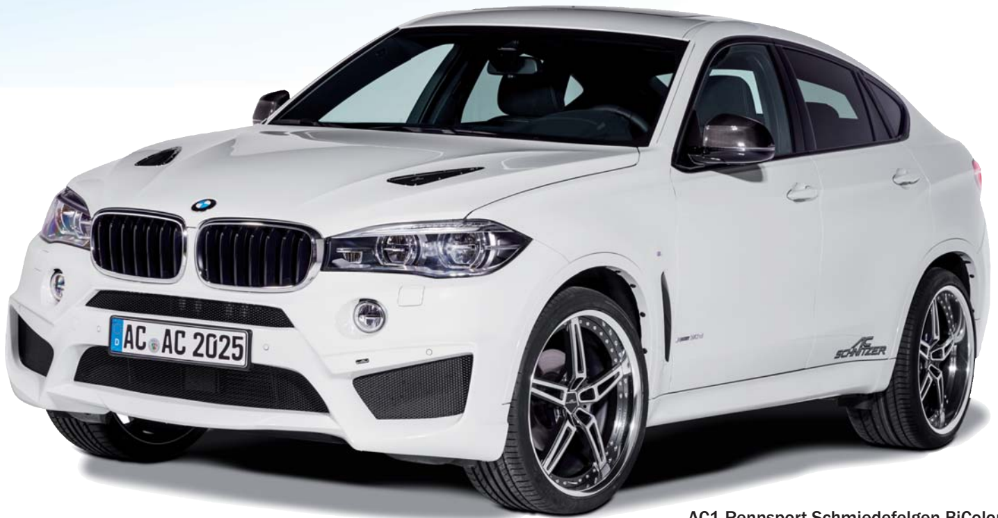
AC1 Rennsport-Schmiedefelgen BiColor